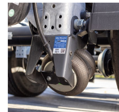
Die Liftachse* als Anfahrhilfe verlängert den Radstand und verstärkt damit den Druck auf die Antriebsachse. Unbeladen reduziert sich in gelifteter Position der Reifenverschleiß.