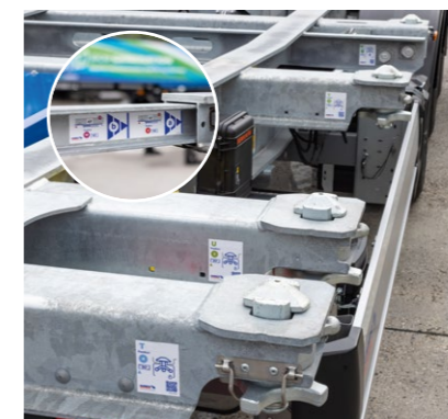
Neue Kennzeichnung an Verriegelungen und Ausschüben für die sichere Identifikation der unterschiedlichen Ladepositionen, unterstützt durch Ladeplan und Bedienvideos via QR-Code.