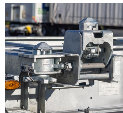
Bei 2 x 20' Beladungen übernimmt der höhenverstellbare KLAPP LOCK die Verriegelung des vorderen Containers.