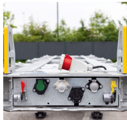
Versenkte Anschlussleiste am Frontbalken mit CEE-Steckdose* auf dem Balken zur Versorgung von Kühlcontainer bei Genset*.