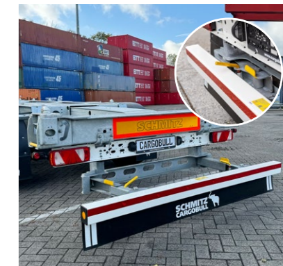
Neu konstruiert: herausfaltbarer Unterfahrerschutz für 45' Container ist einfacher und sicher im Handling ohne lose Teile, die verloren gehen können.