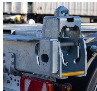
Der höhenverstellbare STEP LOCK* am Heckschub erlaubt mit zwei Handgriffen die Aufnahme von 40' und 45' Containern ohne Tunnel.