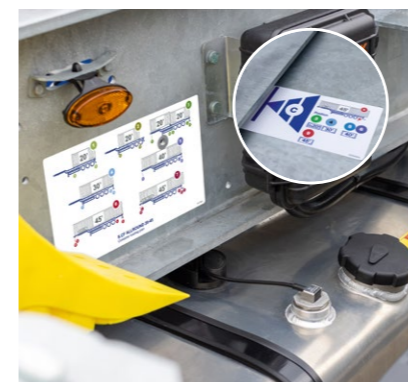
Neues Bedienkonzept mit Ladeplan und eindeutigen Funktions- und Warnhinweisen an Verriegelungen und Ausschüben.