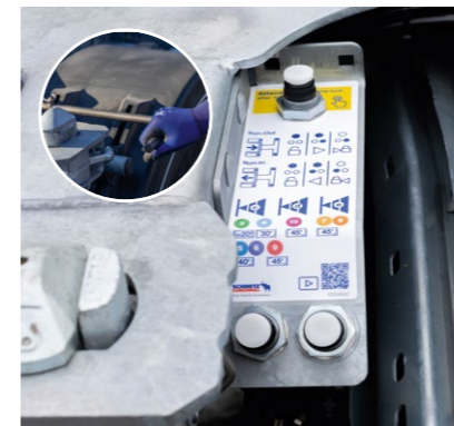
Steuerung für pneumatische Verriegelung für den Heckschub, optional mit manueller Verriegelung*.