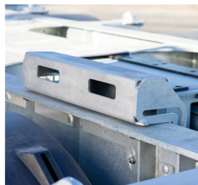
Drei Paar klappbare Containerauflagen* für Container ohne Tunnel.