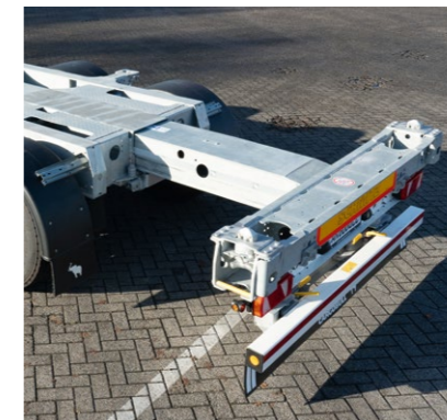
Neu: Gedämpfter Heckschub fährt pneumatisch die gewählte Verriegelungsposition an und bremst sanft ab.